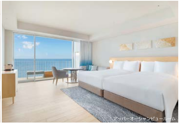
アッパーオーシャンビュールーム